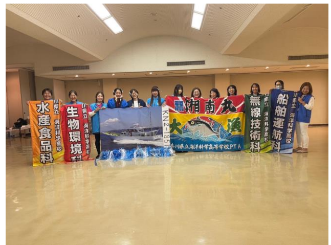
地区大会での発表を終えて