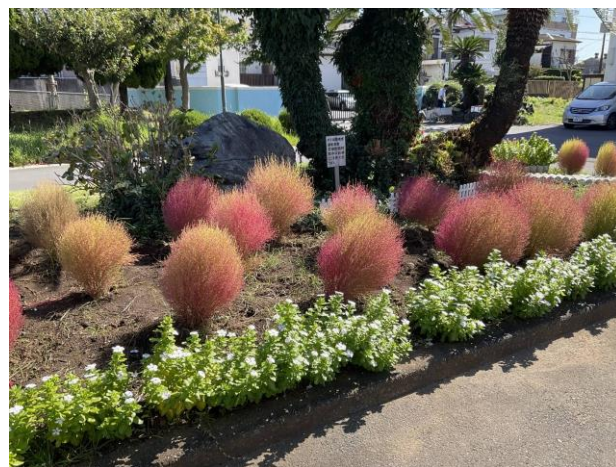
正面玄関前花壇の様子