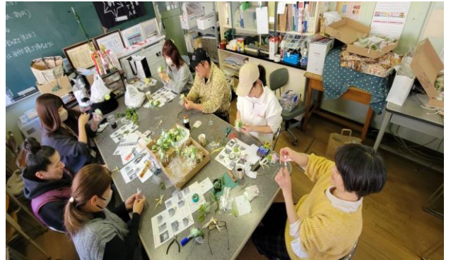
コサージュ作成中

PTA役員がつなげた「アマチュア無線体験会」 「地域の吹奏楽団とジョイントコンサート」