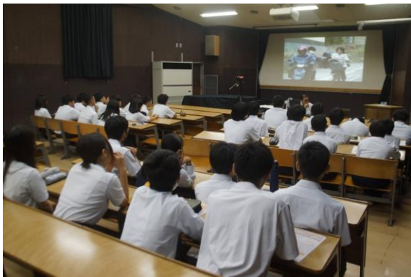
交通安全教室の様子