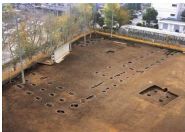
写真3 南側で発見された郡庁 (財) かながわ考古学財団資料 2002年