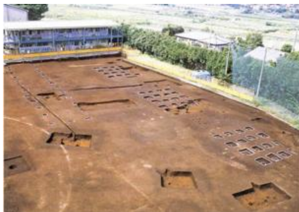
写真2 北側で発見された倉庫（正倉）群と長大な建物