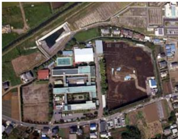
写真1 グラウンドで発見された遺跡の航空写真

茅ヶ崎北陵高等学校を含む周辺地域は、複数の遺跡群が存在する場所であることが昔から知られていました。神奈川県立高校改革推進計画が平成11年に発表され、校舎の建て替え計画が検討されました。その過程の埋蔵文化財試掘調査において、グラウンドに遺跡が発見されました。それにより建て替え計画は見直し、当初、遺跡と共存しながらの校舎建築も考えられました。しかし、遺跡の上には建てられないということで、平成18年度から現在に至るまで臨時校舎での学校生活が続いております。