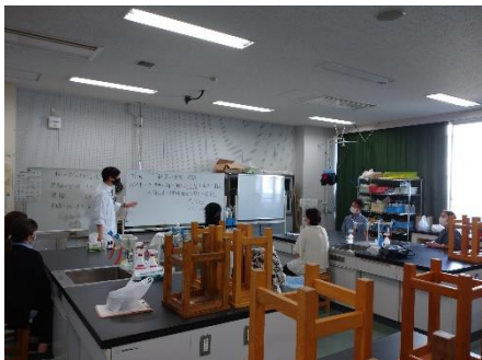
体験③視覚と嗅覚の実験