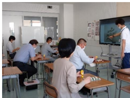
体験④ブロックで作る知育玩具